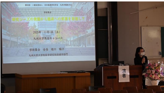
2025年度 第30回看護研究学会地方会開催案内の様子